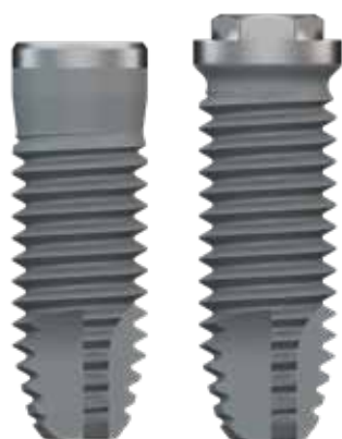
BT KLASSIC INT