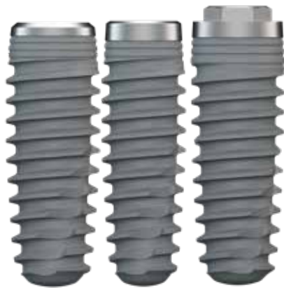
ISY KONE MTH-INT